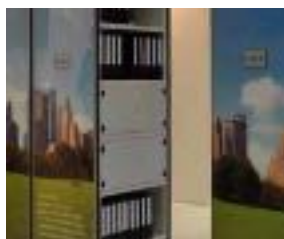
Armadietti a scomparti