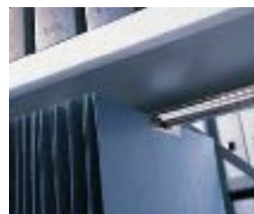
Binario per cartelle sospese ZT