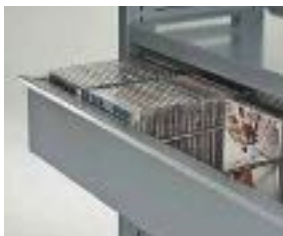
Cassetto per CD / DVD