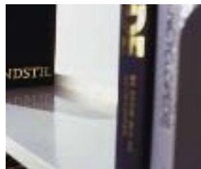
Battuta di arresto posteriore