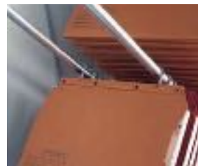
Telaio L'Obique / TUB