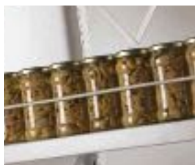
Profilo di contenimento frontale