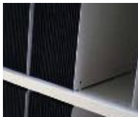
Pannello divisorio in acciaio