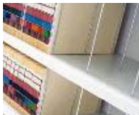
Aste in acciaio